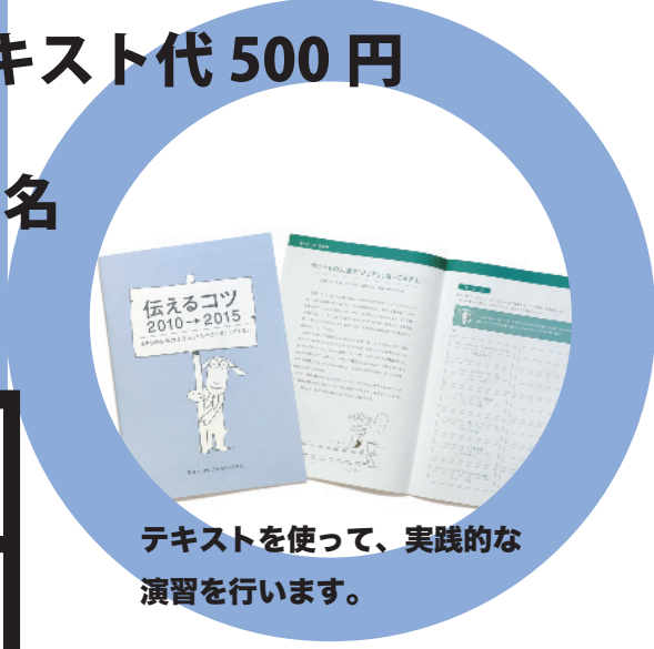
テキストを使って、実践的な演習を行います。