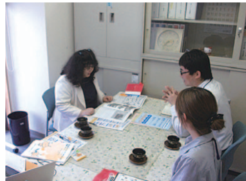
高知市内の団体へのヒアリングもさせてもらった

団体のなかでは、考え方や思いに温度差があるなどまだまだ課題はあるが、互いを尊重しながら楽しんで課題に取り組んでいければ、成果も大きくなり、つながりも強くなるのではないかと考えている。