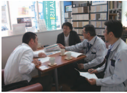
交通まちづくり部会。企業訪問の様子