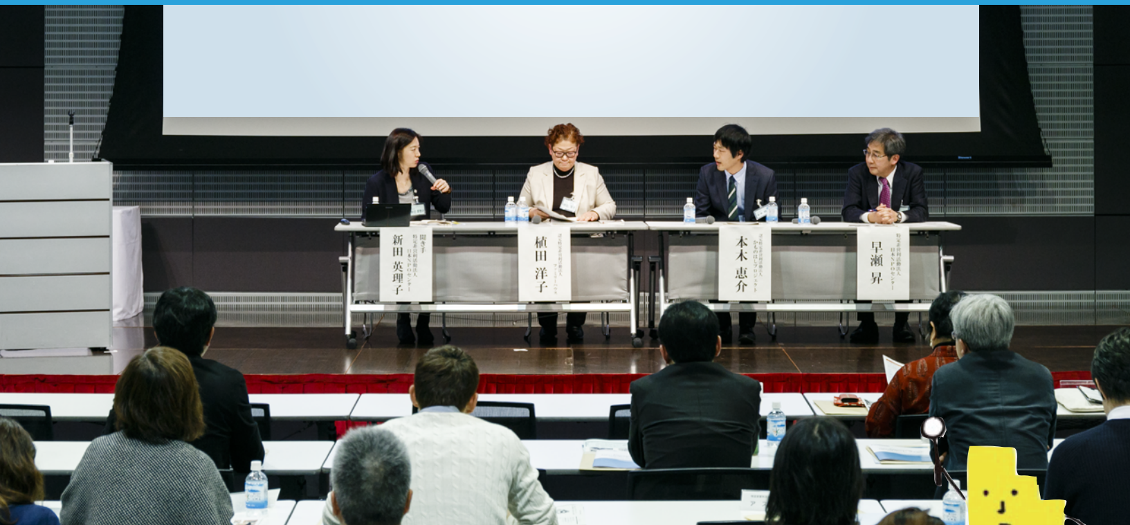
※ 2017年1月の組織基盤強化フォーラムの様子